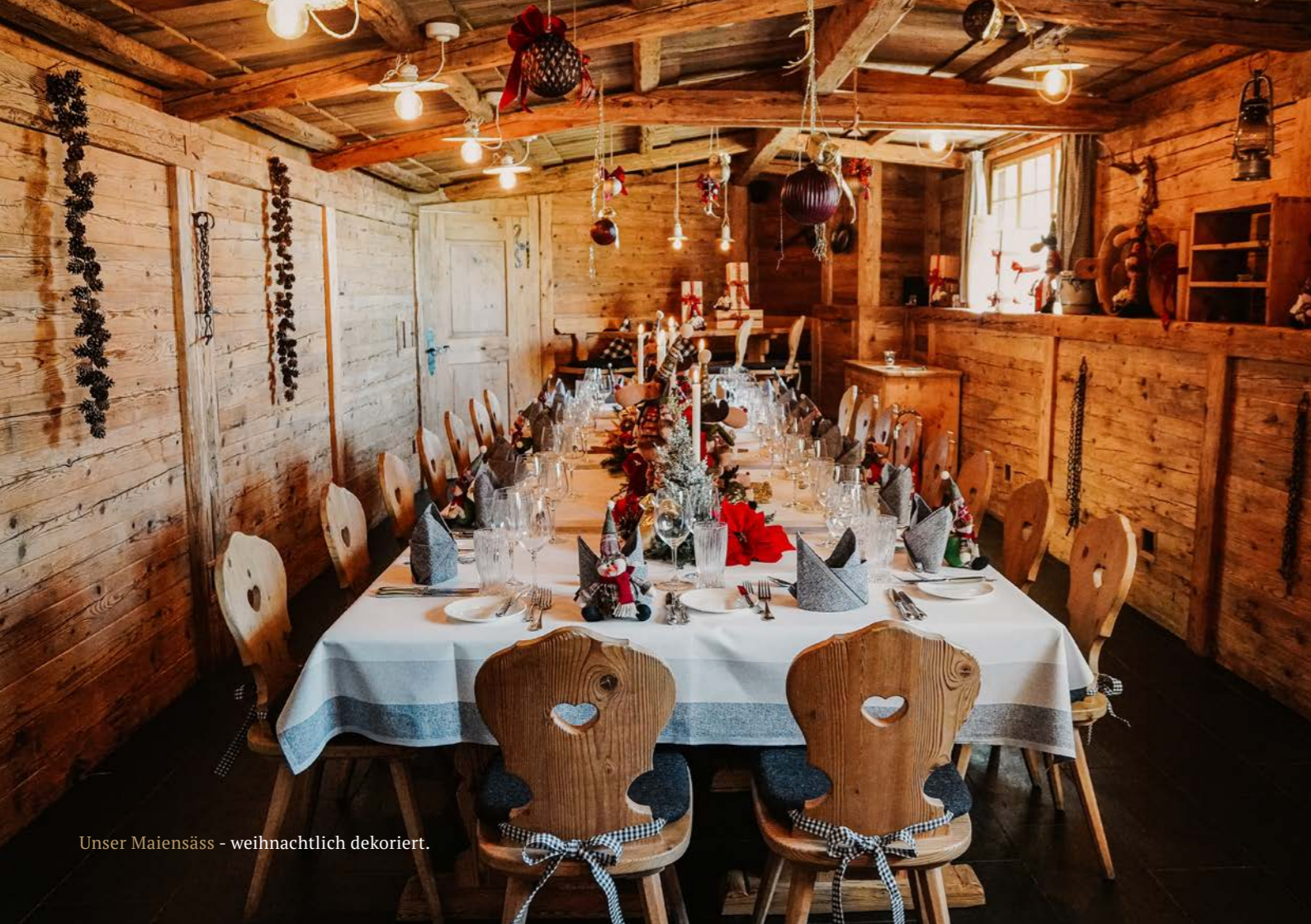
Unser Maiensäss - weihnachtlich dekoriert.